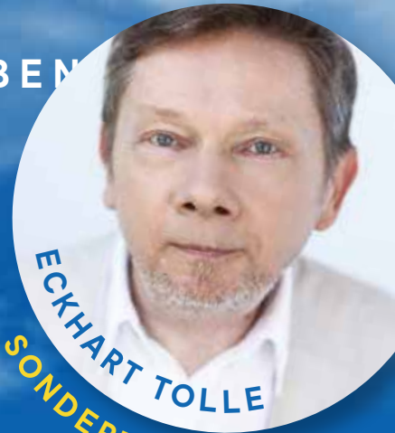
ECKHART TOLLE SONDERTEIL